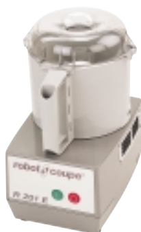
R 201 E