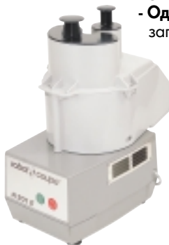
R 201 E