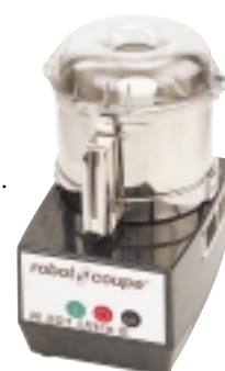
R 201 Ultra E

ВЕС (без диска) Вес нетто 10 кг Вес брутто 12 кг