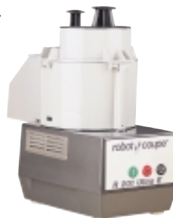
R 201 Ultra E